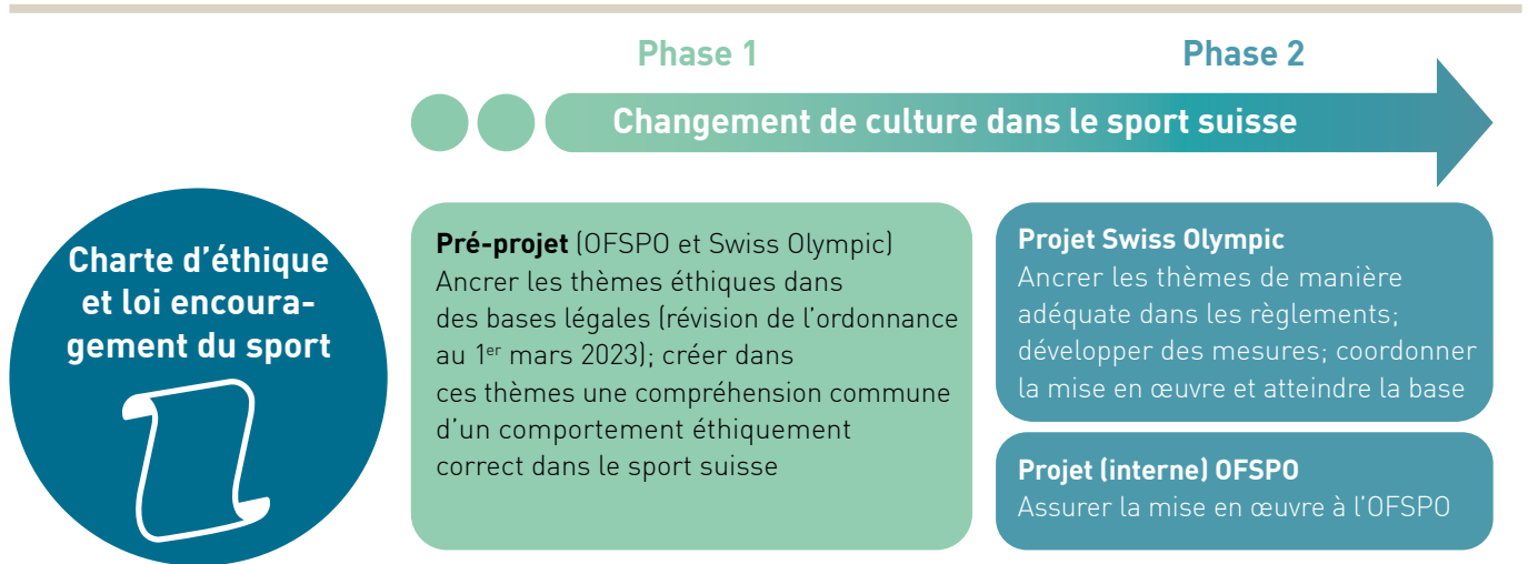
Représentation graphique des phases 1 et 2 du projet «Ethique dans le sport suisse»

Le projet «Ethique dans le sport suisse» a été initié dans le but d'induire un changement à long terme. Il vise à discuter et à définir en profondeur les principes d'action souhaités dans le sport suisse et, sur cette base, à concevoir et à mettre en œuvre les mesures nécessaires pour appliquer ces principes. Il est divisé en deux phases: